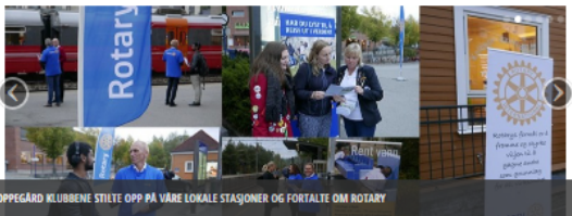
OPPEGÅRD KLUBBENE STILTE OPP PÅ VÅRE LOKALE STASJONER OG FORTALTE OM ROTARY

Distrikt 2260 Rotary i Norge Kolbotn Rotary Oppegård Rotary